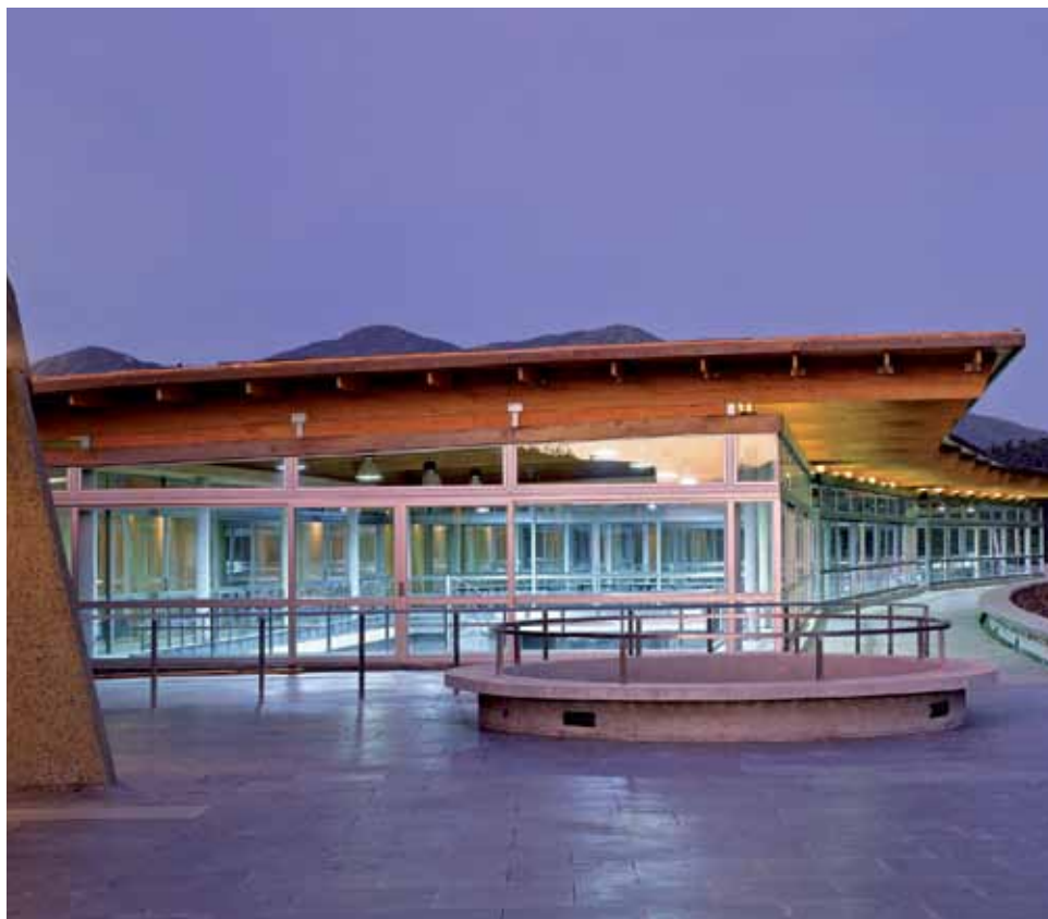
Iz Novoga svijeta jedna od najpopularnijih vinskih zemalja je Čile, koja vino izvozi na sve strane. Sad se eto pokazuje da je unutar zemlje osjetno pojačan trend potrošnje... U Čileu su u vinskom sektoru vrlo aktivne, i cijenjene, i obitelji hrvatskoga porijekla, neke s velikim a neke s manjim posjedima i ekskluzivnijim proizvodima. Među valikima su Lukšići, u vlasništvu koje je div Viña San Pedro, a među manjima Matetići, čiju modernu vinariju vidimo na slici

Riječ-dvije i o svjetskoj trgovinskoj razmjeni : cjelokupna trgovinska razmjena promatrana kroz izvoz vina kretala se u 2010. oko 92,1 milijun hl. Zanimljivo je da je u njoj rinfuzno vino sudjelovalo u količini od gotovo čak 40 posto, a na toj popriličnoj količini ostvareno je u novcu samo 10 posto od ukupne novčane