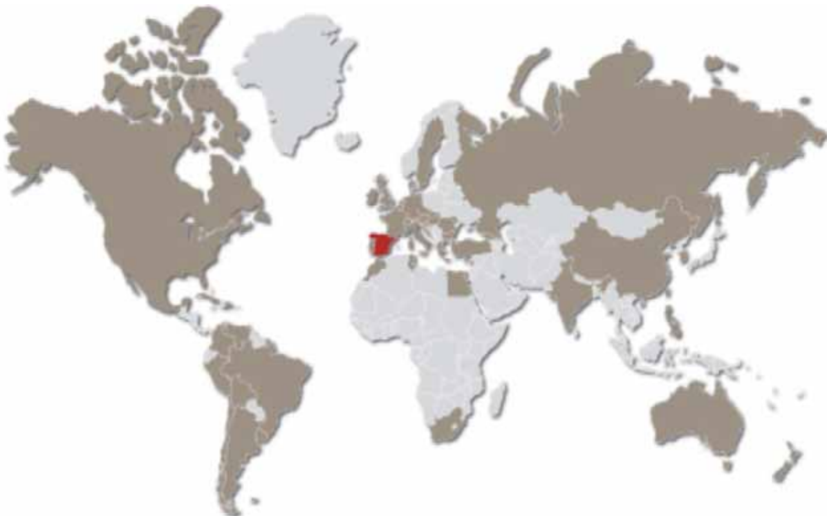
Svijet vina: crvenom bojom označena je Španjolska, zemlja s najviše vinograda

plemenite kapljice na svjetskoj razini, te posebno po zemljama. Ti podaci kažu da su površine pod vinovom lozom u svijetu u