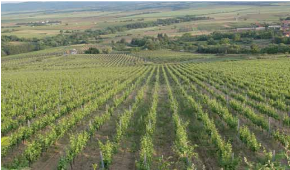
Slavonija: Venje, Kutjevo