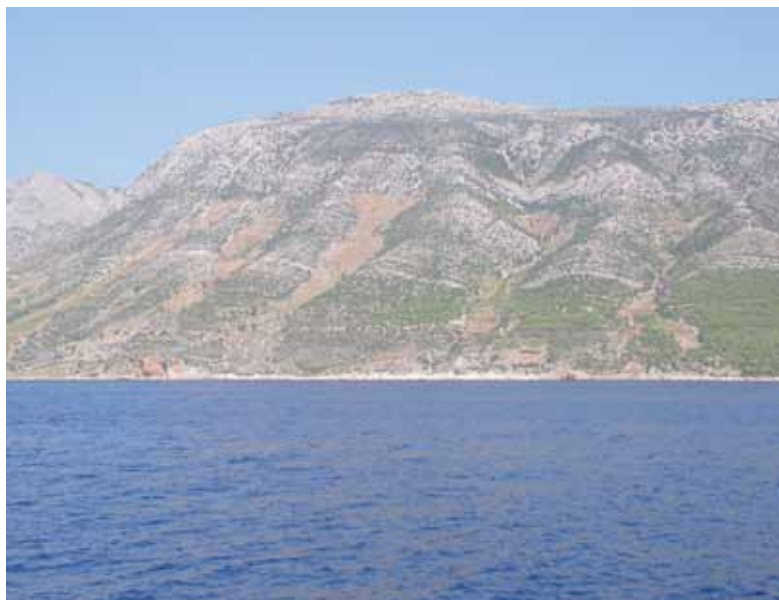
Hvar, južna strana / Hvar, southern slopes: Ivan Dolac