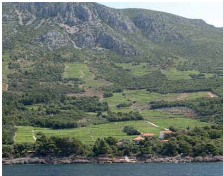
Pelješac, južna strana / Pelješac, southern slopes: Dingač

Najviše je na tržištu, po kategoriji kakvoće / mostly, regarding the quality category, on the market