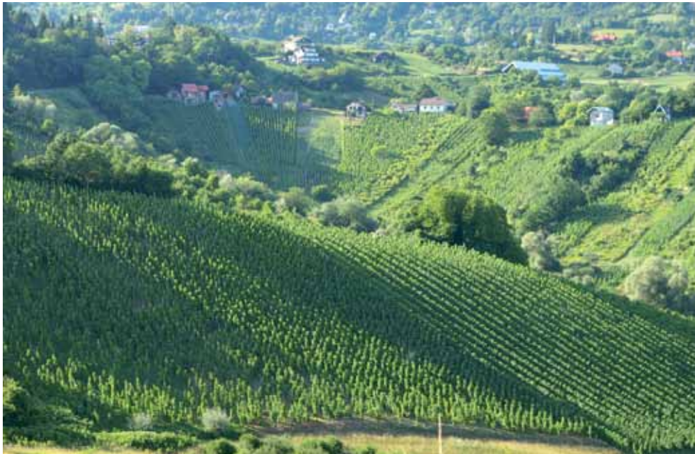
Plešivica, vinogradski amfiteatar, samo 30 kilometara od Zagreba / Plešivica, vineyard amphitheatre, only 30 km from Zagreb