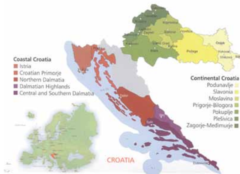
Vinogradarska područja Hrvatske / Vine-growing regions and areas in Croatia

Broj otoka / islands: 1185, od kojih naseljenih / inhabited: 66.