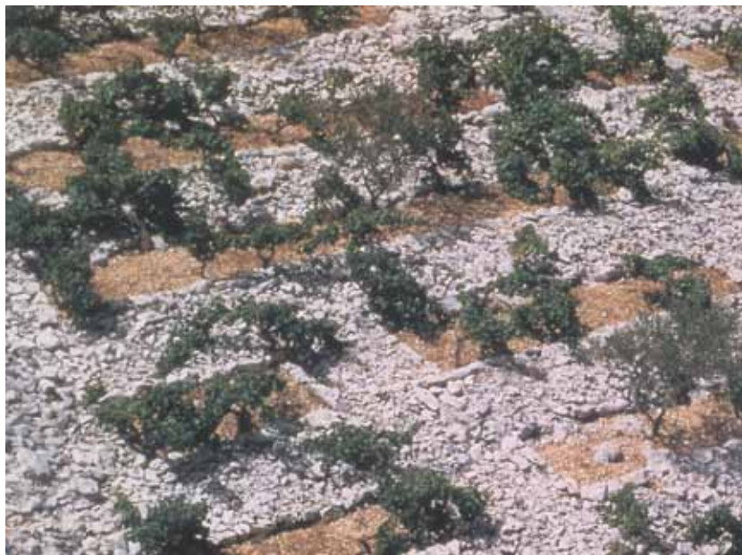
Atraktivne primoštenske čipke Babića / Attractive Primošten Babić embroidery: Primošten, Šibenik

Potrošnja po stanovniku , procjena / estimated consumption per capita: cca 28 lit (podatak/ the data: OIV)